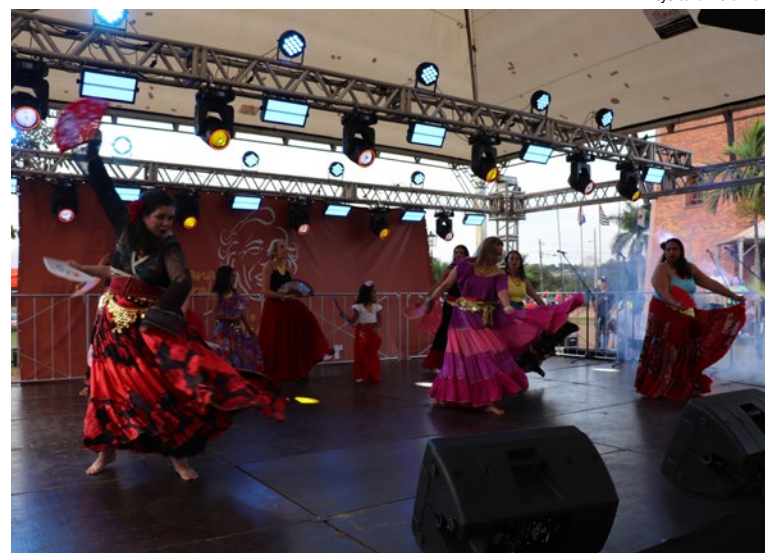
Al Prefeitura Holambra

As inscrições para a Tarde de Talentos seguem abertas até o dia 26 de maio e podem ser feitas pelo site oficial da Prefeitura ( holambra.sp.gov.br ), presencialmente na Biblioteca Municipal ou no Espaço Cidadão. A atividade será realizada na Praça do Moinho Povos Unidos, no dia 1º de junho, domingo à tarde, e promete revelar talentos da comunidade em diversas expressões artísticas.