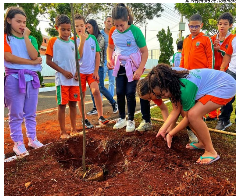
Al Prefeitura de Holambra

Para deixar a cidade ainda mais bonita, cerca de 700 novas mudas de celósias, doadas pela Maxima Flores, passaram a embelezar o Deck do Amor e as Praças Bento Eusébio Tobias e Divino Espírito Santo.