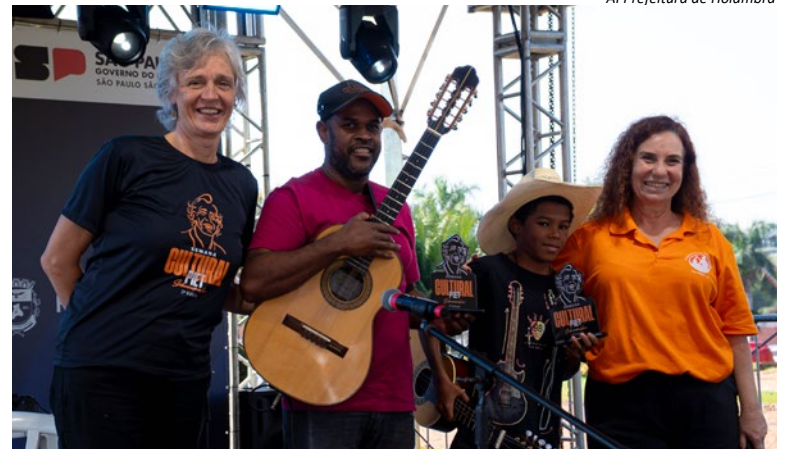
AI Prefeitura de Holambra

Nas escolas municipais, alunos do 1º ao 5º ano participaram de rodas de dança durante o período da manhã, em unidades como Fundão, Palmeiras e Imigrantes. Por conta do calendário escolar, outras instituições de ensino ainda receberão atividades na próxima semana, garantindo que mais crianças tenham contato com esse aspecto formativo da cultura local. (Luis Alves e Bruno Carlstron)