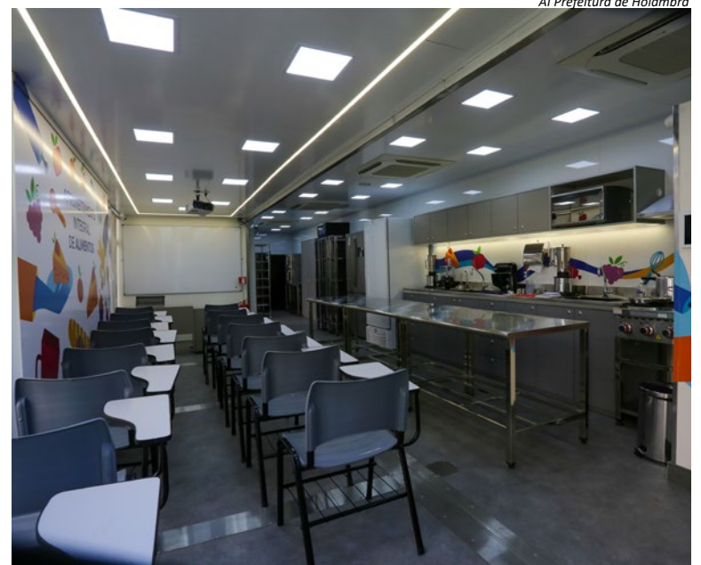
AI Prefeitura de Holambra

Mais informações sobre as atividades podem ser obtidas por meio do telefone (19) 3802-8090 ou presencialmente, no Centro de Referência da Assistência Social, o CRAS, localizado na rua Solidagos, nº99, no bairro Morada das Flores. O horário de atendimento é das 8h às 11h30 e entre 13h30 e 16h. (AI Prefeitura de Holambra)