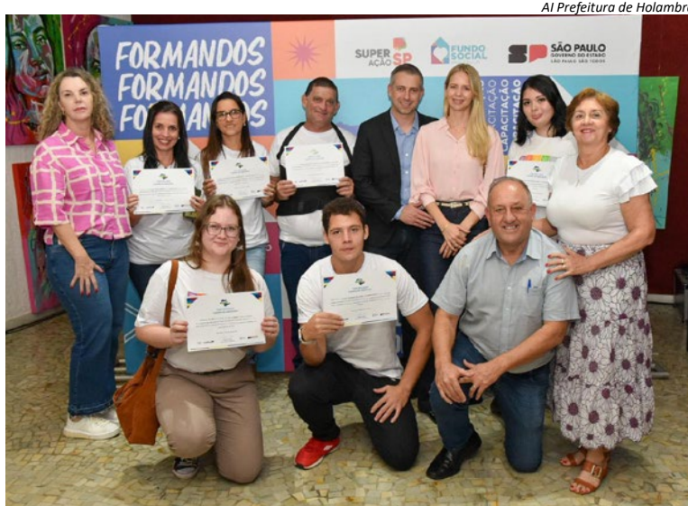
AI Prefeitura de Holambra

Os alunos holambrenses concluíram os cursos de Auxiliar de Cozinha e Gastronomia com Reaproveitamento de Alimentos, promovidos entre os