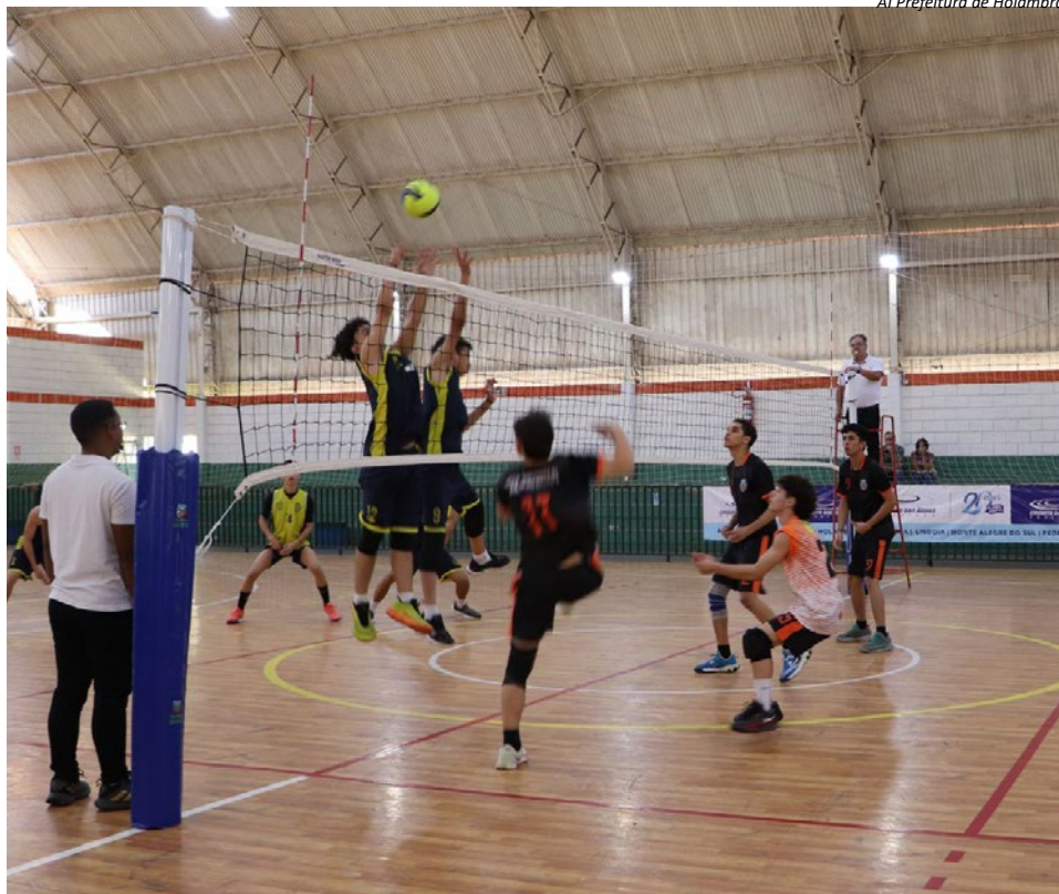
Al Prefeitura de Holambra