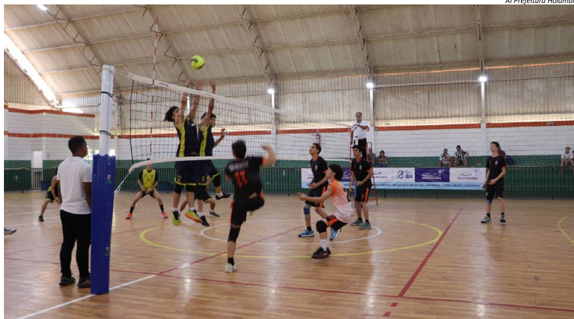
Al Prefeitura Holambra

exemplo de Holambra, participa em todas as modalidades – exceção feita ao basquete, com equipes apenas da Cidade das Flores, de Pedreira e Jaguariúna. Essa foi a segunda etapa dos jogos, dando sequência à rodada de abertura. Em agosto será a vez de Lindóia sediar os jogos. Depois ocorrem a semifinal e a final, que serão em Amparo e Pedreira.