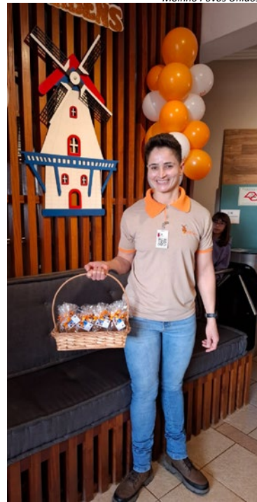
Moinho Povos Unidos