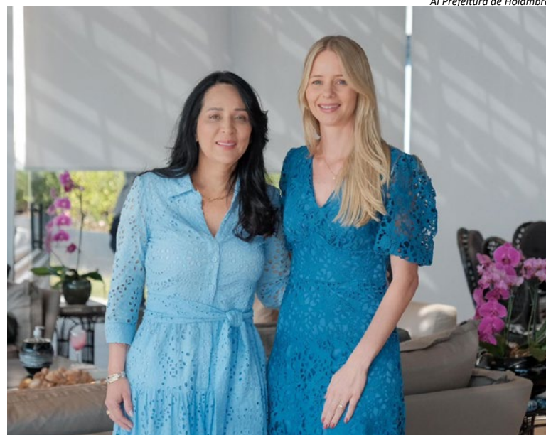
AI Prefeitura de Holambra

Lançado em maio, o programa Caminho da Capacitação oferece cursos gratuitos de qualificação profissional em carretas móveis adaptadas como salas de aula itinerantes. A iniciativa faz parte do SuperAção SP, programa do Governo do Estado de São Paulo que tem como meta retirar mais de 100 mil famílias da linha da pobreza até 2026. (AI Prefeitura de Holambra)