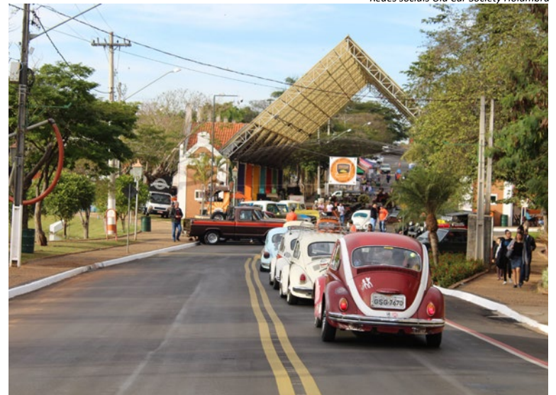
Redes sociais Old Car Society Holambra

Uma feira de carros antigos é importante na medida que preserva a história automobilística, o entretenimento e a geração de negócios. Com certeza atraem colecionadores, entusiastas, promovendo cultura, lazer e apresenta um expressivo potencial econômico. Tem mais: estas feiras e encontros despertam a vinda de pessoas de outras regiões e até de outros países, movimentando hotéis, restaurantes, comércio em geral e assim o Turismo agradece.