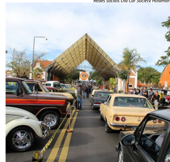
Redes sociais Old Car Society Holambra