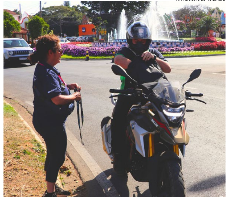
AI Prefeitura de Holambra

tos é de 597 em território paulista, incluindo 149 pedestres, 39 ciclistas, 272 motociclistas e 108 usuários de automóvel. Já a região administrativa de Campinas, que abrange 25 cidades, registrou entre janeiro e julho, o montante de 5.301 acidentes e 467 óbitos. As que já passaram por esse treinamento educacional contra acidentes foram Campinas, Jaguariúna, Valinhos, Monte Mor, Indaiatuba, Mogi Mirim, Mogi Guaçu, Sumaré, Limeira, Hortolândia, Nova Odessa, Itapira, Conchal, Cosmópolis, Santa Bárbara do Oeste, Americana e Paulínia. (AI Prefeitura de Holambra)