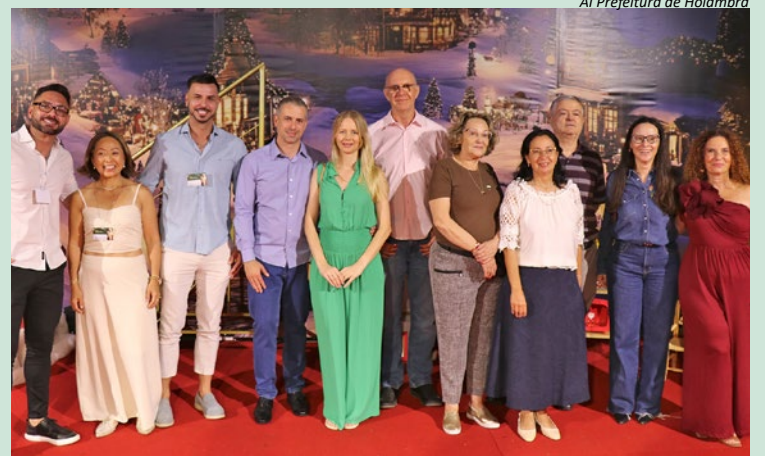
A1 Prefeitura de Holambra

Sonhos, apresentado duas vezes por dia, a Parada de Natal com carros alegóricos iluminados, jardins temáticos, Casa do Papai Noel, espaços instagramáveis e momentos de neve artificial. Moradores com Cartão Cidadão válido e cadastro atualizado em 2025 têm direito a uma entrada gratuita por dia. Menores de 16 anos só podem entrar acompanhados dos pais ou responsáveis.