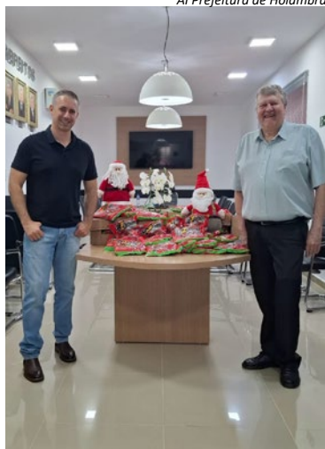
AI Prefeitura de Holambra

agradecer à ACE-Holambra pela parceria para o nosso Natal Mágico de Holambra. Muito obrigado por caminhar conosco e contribuir para que o Natal em nossa cidade seja sempre cheio de encanto, carinho e boas lembranças!"