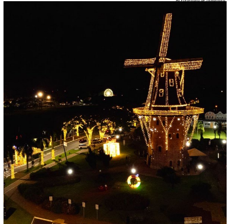
A1 Prefeitura de Holambra

O prefeito Fernando Capato destaca que o evento representa mais do que celebração: é uma oportunidade de fortalecimento cultural, turístico e econômico. “O Natal Mágico reforça a identidade de Holambra como cidade acolhedora e vibrante. É um período em que valorizamos nossas tradições, movimentamos o comércio local e celebramos o sentimento de união que marca a nossa comunidade. Queremos que cada morador e visitante viva essa experiência com alegria e esperança”, pontuou. Veja a programação completa na página 4. (A1 Prefeitura de Holambra)