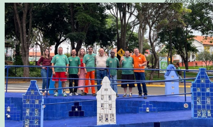
A Prefeitura de Holambra

Durante a visita, o prefeito elogiou o empenho das equipes envolvidas na obra. “Reconhecimento e gratidão a todos os envolvidos! Valeu a pena!”, destacou.