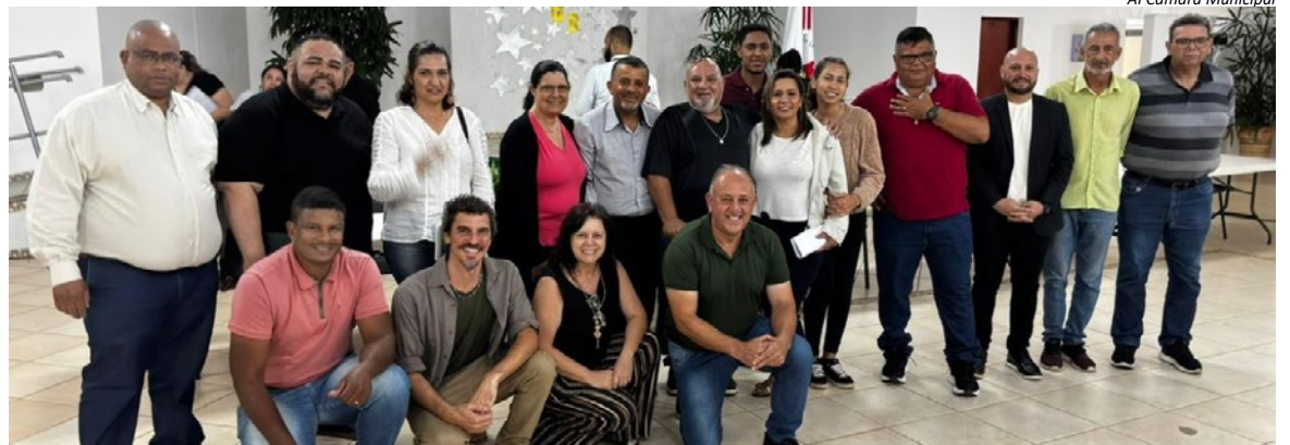
AI Câmara Municipal

A primeira edição do ano aconteceu no dia 7 de abril, no bairro Imigrantes, e teve excelente adesão. Assim como naquela ocasião, a sessão desta segunda reforçou o interesse dos holambrenses em acompanhar de perto o trabalho legislativo e participar das decisões que impactam o desenvolvimento da cidade.