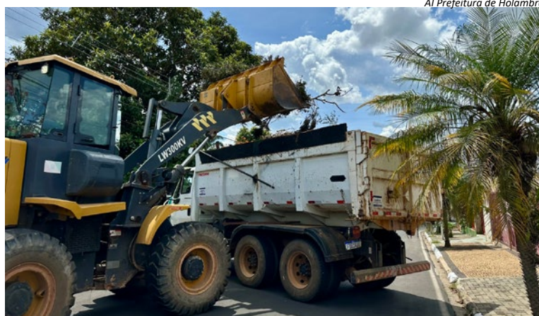
A Prefeitura de Holambra

Ele explica ainda que lixo doméstico, restos de construção e equipamentos eletrônicos não são coletados nesta ação e que em caso de chuva, a atividade poderá ser cancelada. (A Prefeitura de Holambra)