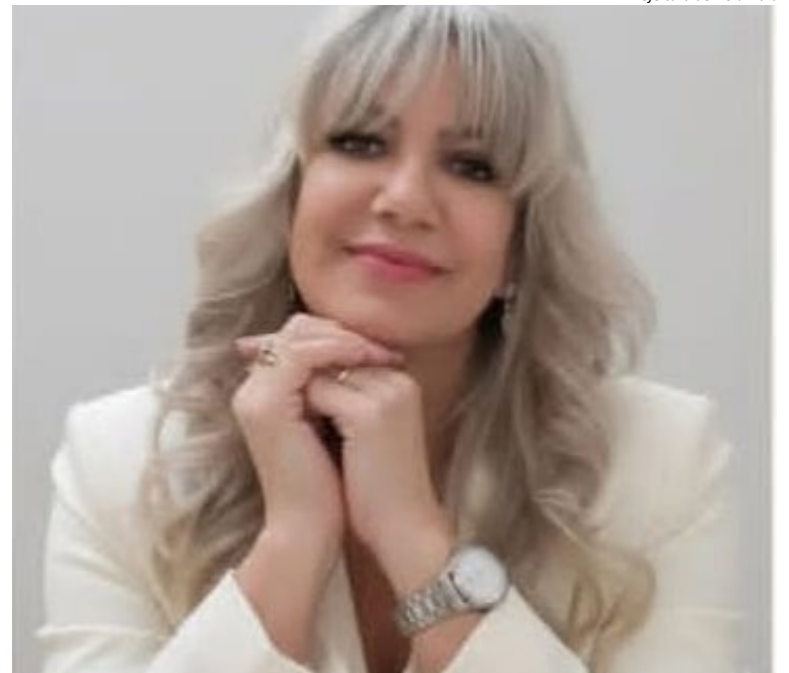
Al Prefeitura de Holambra

A profissional atende no Consultório Terapêutico Interação, na Rua Belis, 61, bairro Girassol, em Holambra, e na Clínica IMEJ (Instituto Médi-