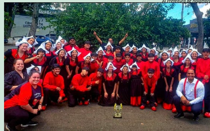
Al Prefeitura de Holambra

Em nota, a Prefeitura de Holambra parabenizou os músicos, a equipe técnica e os familiares pelo empenho e pela conquista.