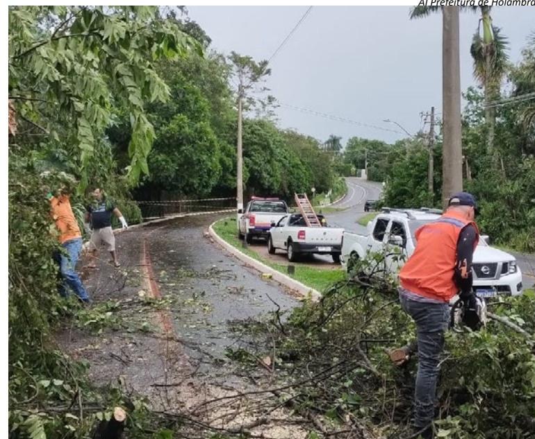
Al Prefeitura de Holambra

Ele acrescenta que a idade das árvores, o histórico de podas e o espaço insuficiente para desenvolvimento contribuem para a instabilidade. “Para tal, devemos realizar um diagnóstico de cada árvore e avaliar o risco de tombamento. Também abrir mais espaço ao redor de cada árvore e evitar cimentar a calçada até o tronco, o que deixa as árvores mais suscetíveis.”