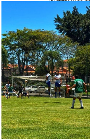
Al Prefeitura de Holambra

tura adequada e ambiente seguro para atletas e comissões técnicas. Segundo a prefeitura, esses fatores têm colocado o Estádio Zeno Capato no radar de competições importantes.