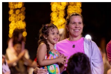
Al Prefeitura de Holambra

A programação do Natal Mágico segue ao longo de todo o próximo mês e inclui desfiles, apresentações culturais e atividades especiais para crianças.