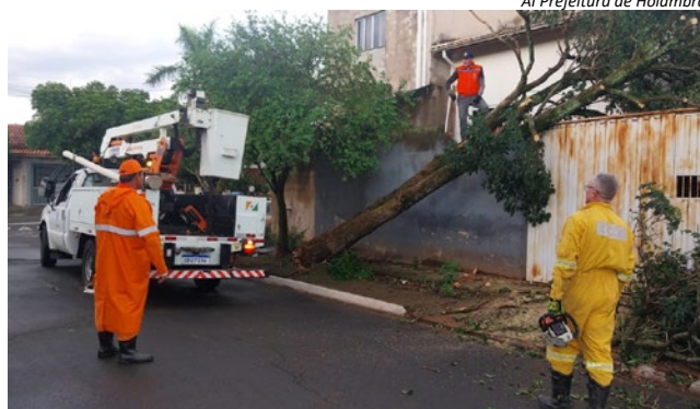
Al Prefeitura de Holambra

Defesa Civil conclui remoção das vias afetadas e especialista explica fatores que podem contribuir para tombamentos em eventos climáticos extremos. 3