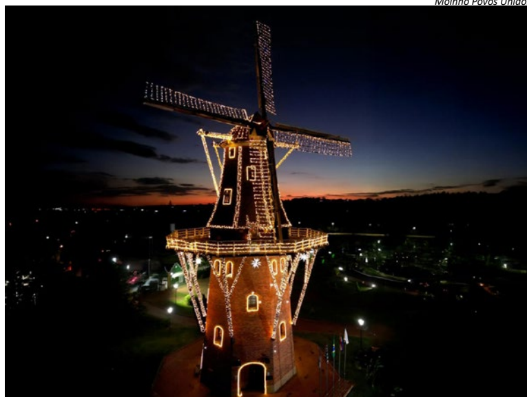
Moinho Povos Unidos

busca aproveitar o clima festivo, o Moinho adotou horário especial para o mês de dezembro. A visitação ocorre de quarta a domingo, das 10h às 17h, com ampliação em sextas-feiras selecionadas. Nos dias 28 de novembro, 5, 12 e 19 de dezembro, o espaço permanecerá aberto até as 21h, permitindo que visitantes vivam a magia da iluminação noturna e registrem fotos no cenário especial.