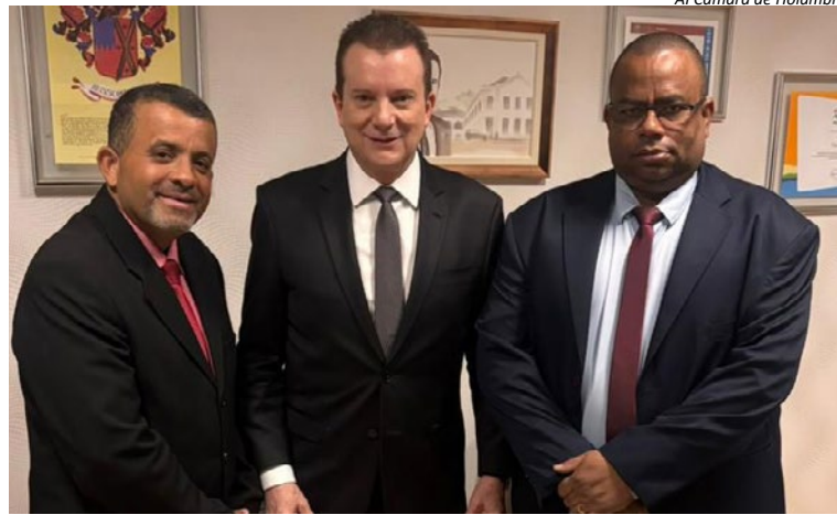
AI Câmara de Holambra

Além disso, o vereador ressaltou que outra emenda de R$ 200 mil já foi solicitada ao parlamentar para investimentos na infraestrutura pública, reforçando o compromisso em