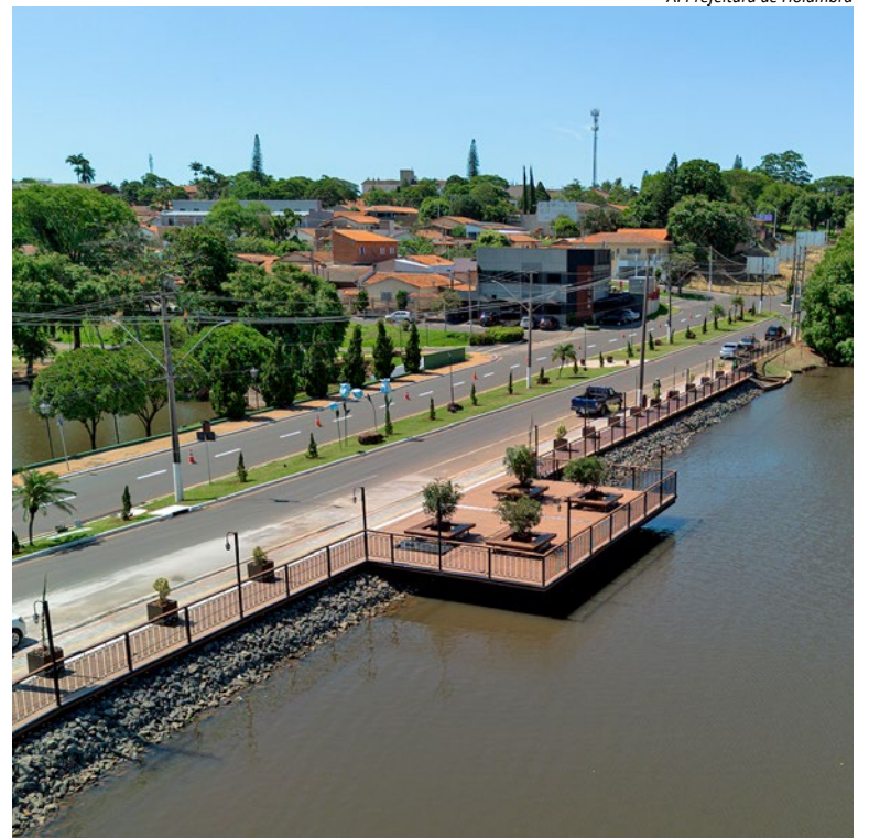
AI Prefeitura de Holambra

O Deck do Lago do Holandês fica na Avenida das Tulipas, s/nº, no Centro. (AI Prefeitura de Holambra)