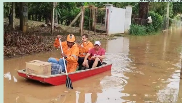
Al Prefeitura de Holambra

A Defesa Civil segue monitorando o nível do rio e as condições climáticas. O órgão orienta a população a não atravessar áreas alagadas, evitar se aproximar do rio, desligar a energia elétrica e o gás em locais com risco de inundação e buscar abrigo seguro em caso de necessidade. A situação permanece sob acompanhamento das equipes municipais.