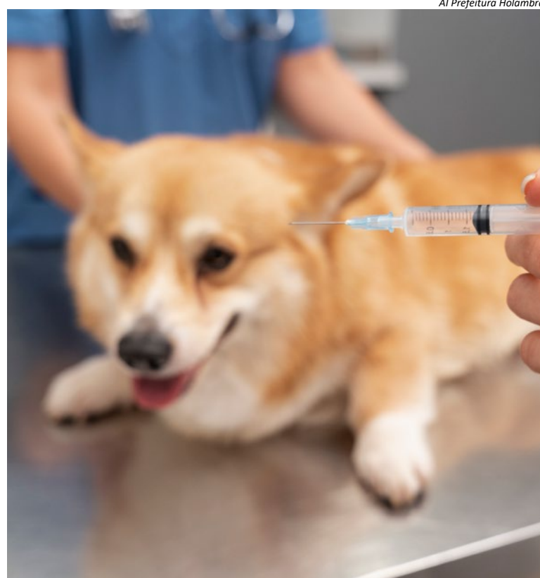
AI Prefeitura Holambra

meses; em gatos, pode ir de uma semana a vários meses. Já em humanos, os sintomas podem aparecer entre sete e até 45 dias. No início, os sinais podem se confundir com os de uma gripe comum, como febre, dor de cabeça, mal-estar e fraqueza. Com a progressão da doença, podem surgir quadros mais graves, como alucinações, espasmos musculares involuntários e paralisia. “Em caso de mordida ou arranhão, é fundamental lavar imediatamente o local com água e sabão e procurar a unidade de saúde mais próxima, levando todas as informações possíveis sobre o ocorrido”, orientou Angela. (AI Prefeitura Municipal de Holambra)