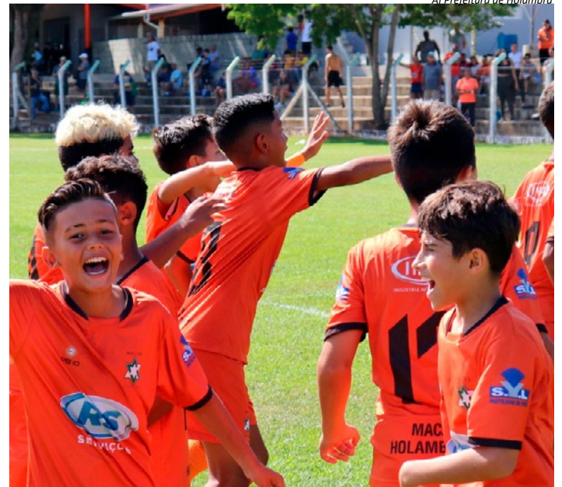
AI Prefeitura de Holambra

Esta seletiva representa a última oportunidade para atletas que sonham em disputar o Campeonato Paulista vestindo a camisa de um clube reconhecido pela seriedade, organização, estrutura e compromisso com a formação esportiva." (AI Prefeitura Municipal de Holambra)