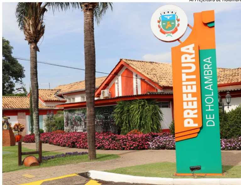
Al Prefeitura de Holambra

Os ônibus do transporte público municipal funcionarão,