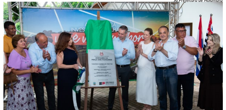
Al Prefeitura de Holambra