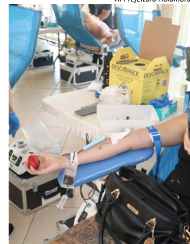
AI Prefeitura Holambra