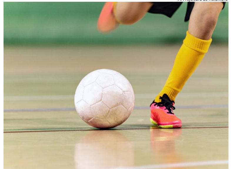
AI Prefeitura de Holambra

O campeão e o vice-campeão receberão troféus e medalhas. Também serão premiados o artilheiro, a defesa menos vazada, o melhor jogador do campeonato e o melhor jogador da final. Mais informações podem ser obtidas pelo telefone (19) 3802-8098." (AI Prefeitura Municipal de Holambra)