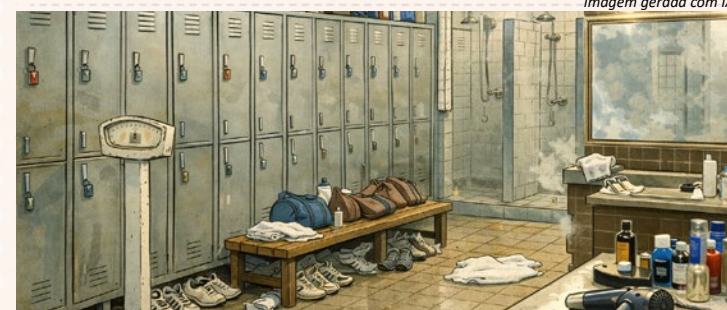
Imagem gerada com IA

A gente entra sujo de suor. E sai de alma lavada.