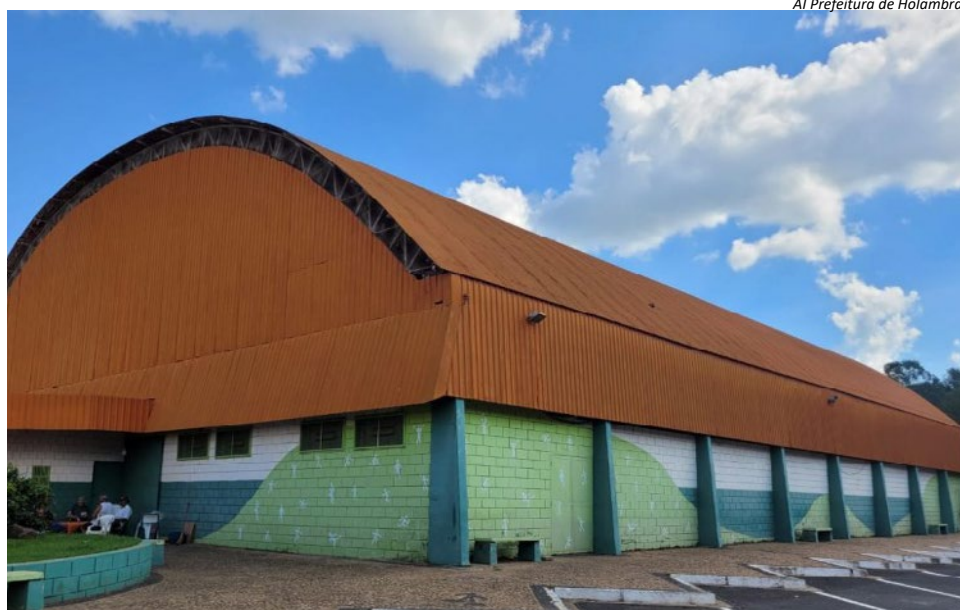
Al Prefeitura de Holambra

Prefeitura realiza seletivas para formar times de futebol e futsal