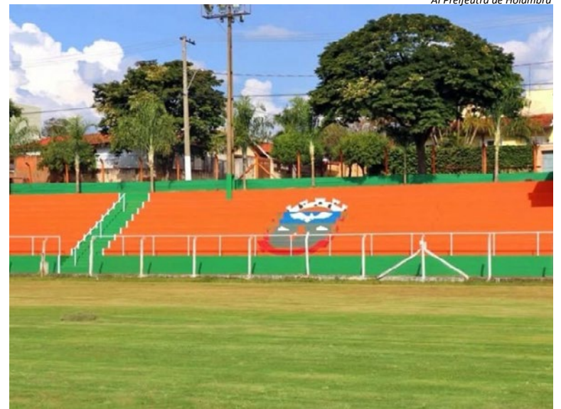
Al Prefeitura de Holambra

A ação integra o trabalho de incentivo ao esporte desenvolvido pelo município, buscando identificar novos talentos e fortalecer as equipes que defenderão Holambra.