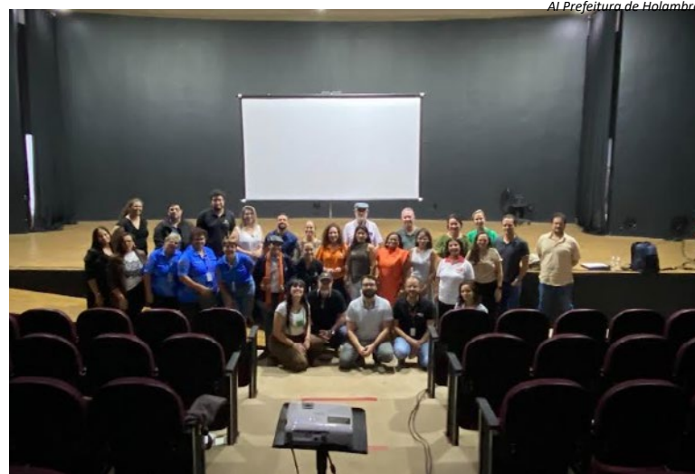
Al Prefeitura de Holambra

A diretora também ressaltou a importância da participa-