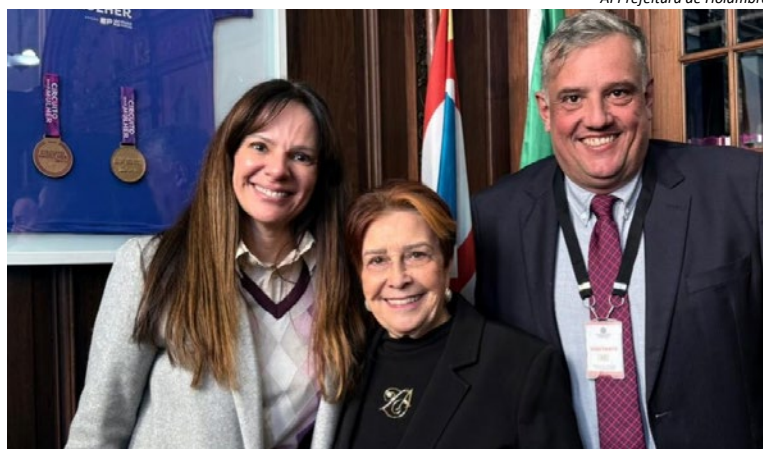
AI Prefeitura de Holambra

Durante a reunião, foram debatidas estratégias para ampliar o incentivo à prática esportiva, promover integração entre os municípios e estimular o desenvolvimento de iniciativas regionais. A proposta é for-