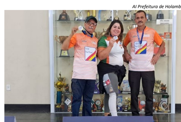
Al Prefeitura de Holambra

Município se destaca na Copa Esportiva da Terceira Idade 10