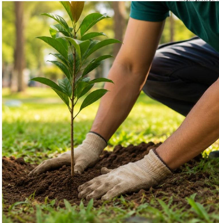
Imagem gerada por IA

A iniciativa conta com o apoio da Prefeitura Municipal de Holambra e tem a HC2 Soluções como responsável técnica. A empresa será responsável pelo planejamento, orientação técnica e acompanhamento das etapas do projeto, assegurando