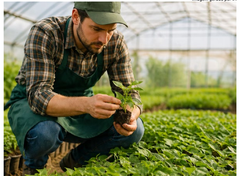
Imagem gerada por IA

A ETEC Pedro Ferreira Alves está localizada na Rua Ariovaldo Silveira Franco, 237, no Jardim Mirante, em Mogi Mirim.