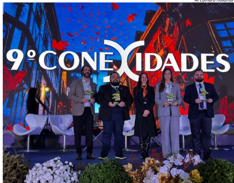
AI Câmara Holambra

"É uma honra imensa estar à frente desse painel. Para mim, não é só sobre debater