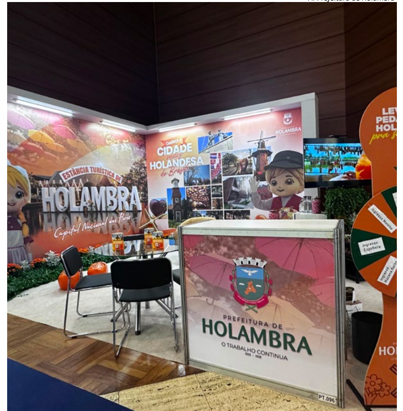
AI Prefeitura de Holambra

O Conexidades reúne anualmente milhares de participantes e se consolidou como um importante espaço de diálogo, networking e construção de parcerias entre o poder público, a iniciativa privada e entidades da sociedade civil. (AI Prefeitura)