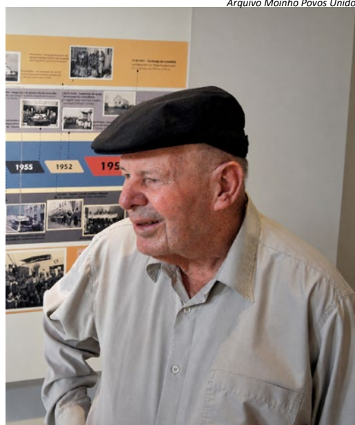
Arquivo Moinho Povos Unidos