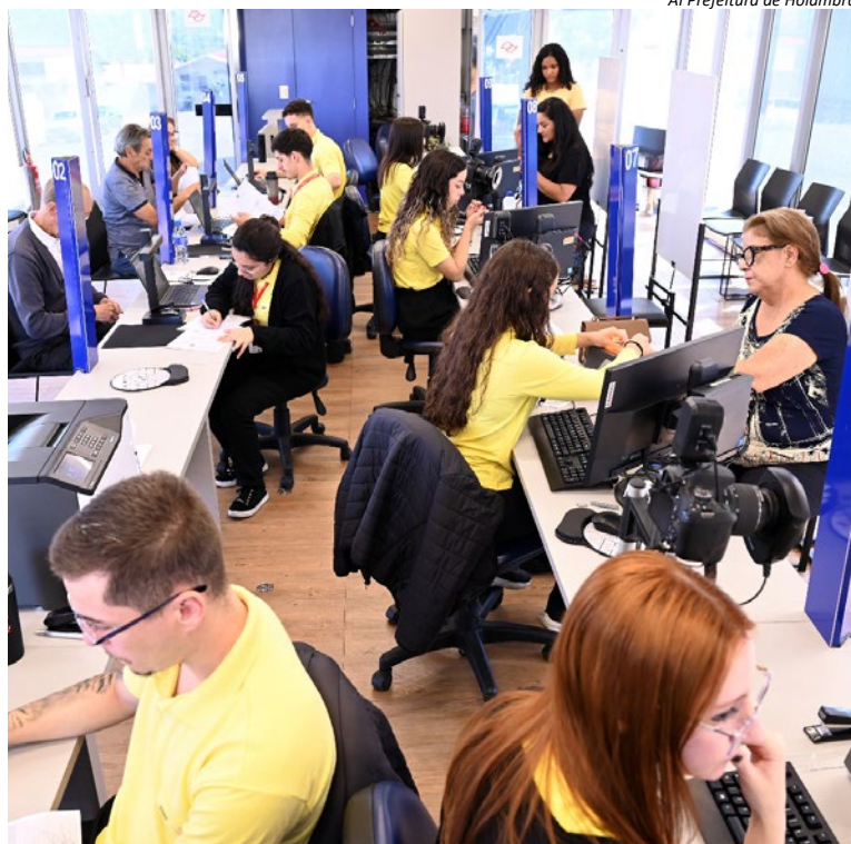
AI Prefeitura de Holambra

A carreta também oferecerá atendimento voltado à intermediação de mão de obra, entrada em pedidos de segu-