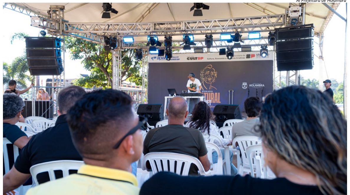
AI Prefeitura de Holambra