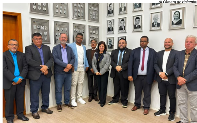
AI Câmara de Holambra

Mais do que uma homenagem, o descerramento da placa representa o reconhecimento da história construída por aqueles que passaram pelo Legislativo Municipal, fortalecendo o compromisso da Câmara com a valorização de sua memória, de suas ins-