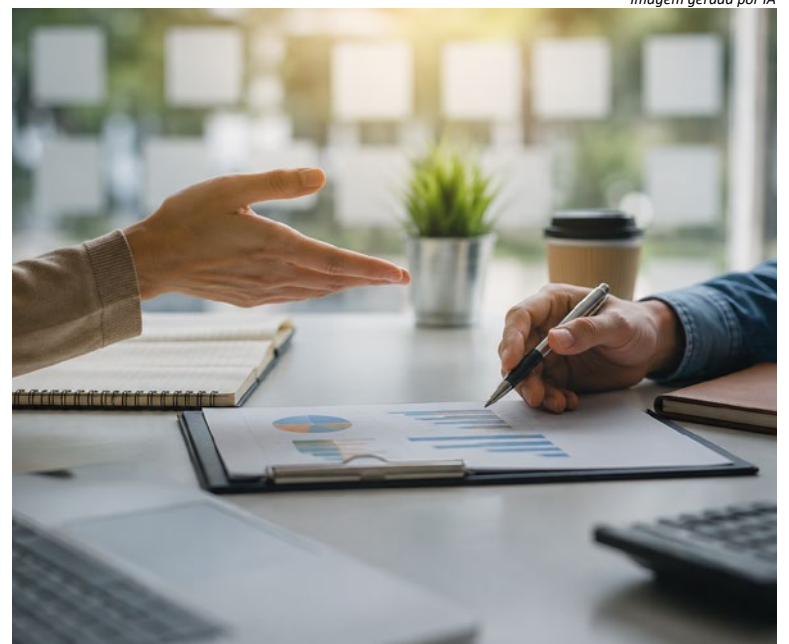
Imagem gerada por IA

As inscrições já estão abertas e podem ser realizadas online. Os interessados devem garantir a participação por meio do link: Inscrição no curso . As vagas são limitadas.